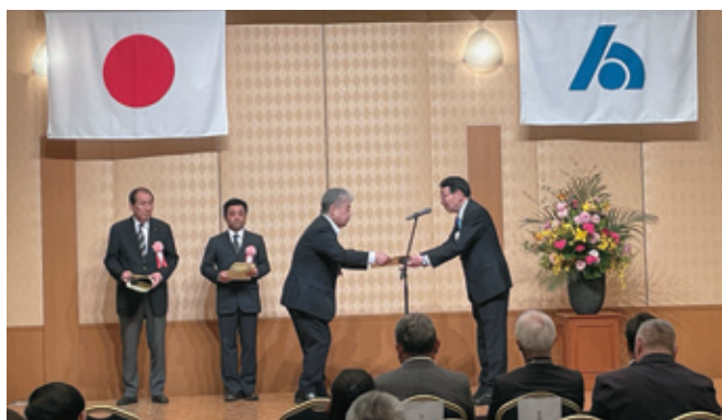
表彰を受ける受賞者