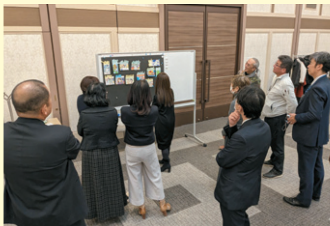
絵はがき審査時の様子