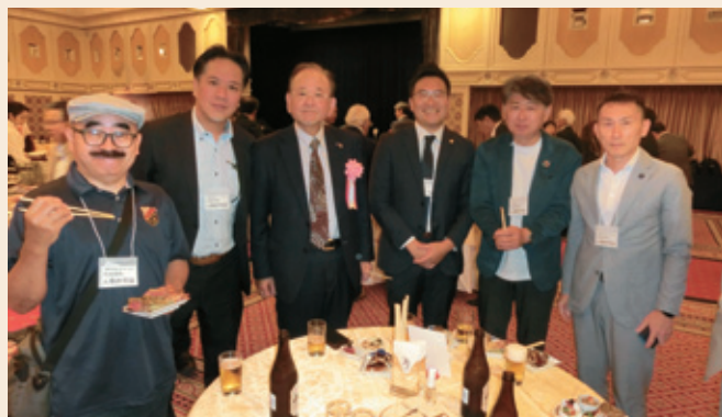
会員交流会の一場面