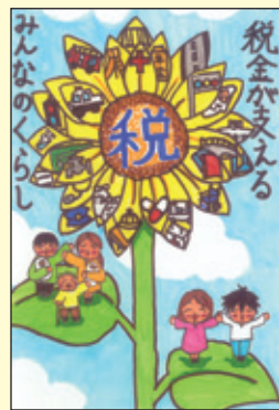
会長賞 春吉小学校 6年1組