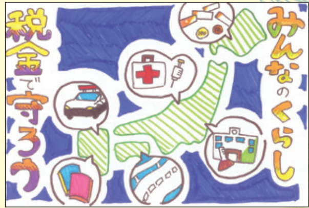
税務署長賞 弥永西小学校 6年1組