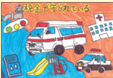
会長賞 高宮小学校 6年2組