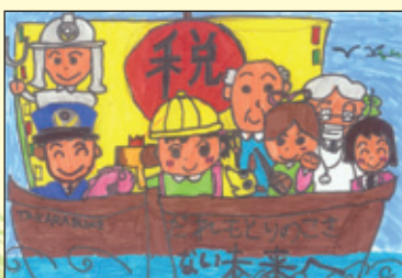
会長賞 野多目小学校 6年1組