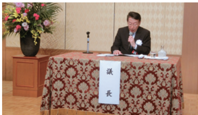
議長を務める柴戸会長