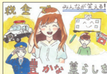
会長賞 三宅小学校 6年3組