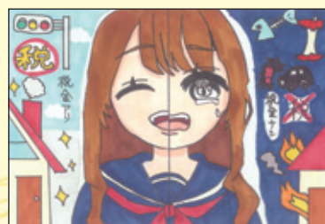
会長賞 長丘小学校 6年3組