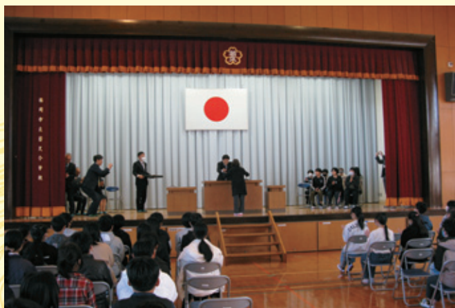
若久小学校での表彰の様子