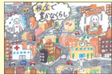
会長賞 警固小学校 6年4組