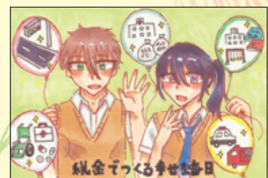
会長賞 舞鶴小学校 6年3組