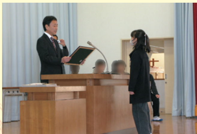
福岡税務署 藤岡署長より表彰を受ける生徒