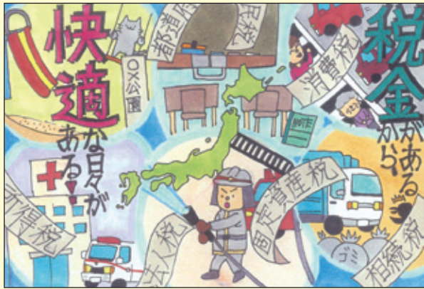
全法連女連協会会長賞・国税局長賞 若久小学校 6年1組