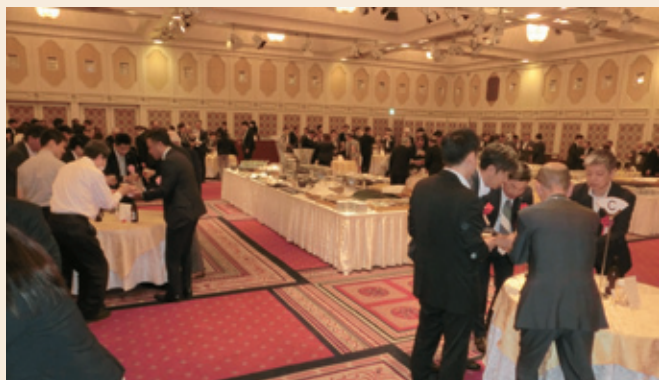
会員交流会会場の様子