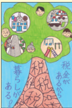
会長賞 老司小学校 6年1組