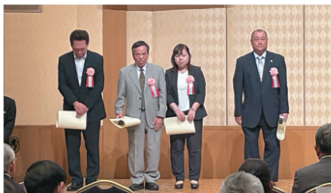
表彰された受賞者