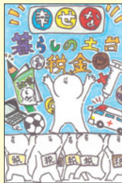
会長賞 南当仁小学校 6年2組