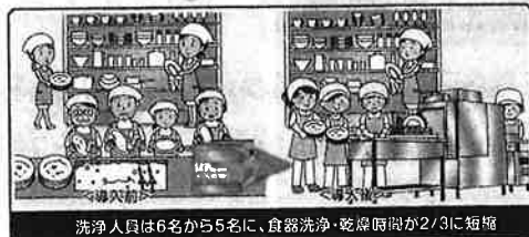
洗浄人員は6名から5名に、食器洗浄・乾燥時間が2/3に短縮