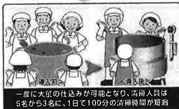
一度に大量の仕込みが可能となり、清掃人員は5名から3名に、1日で100分の清掃時間が短縮