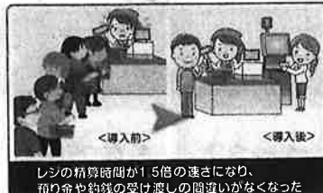
レジの精算時間が1.5倍の速になり、預り金や釣銭の受け渡しの間違いがなくなった